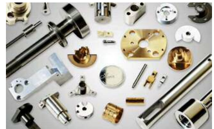
複雑な形状に自信あり